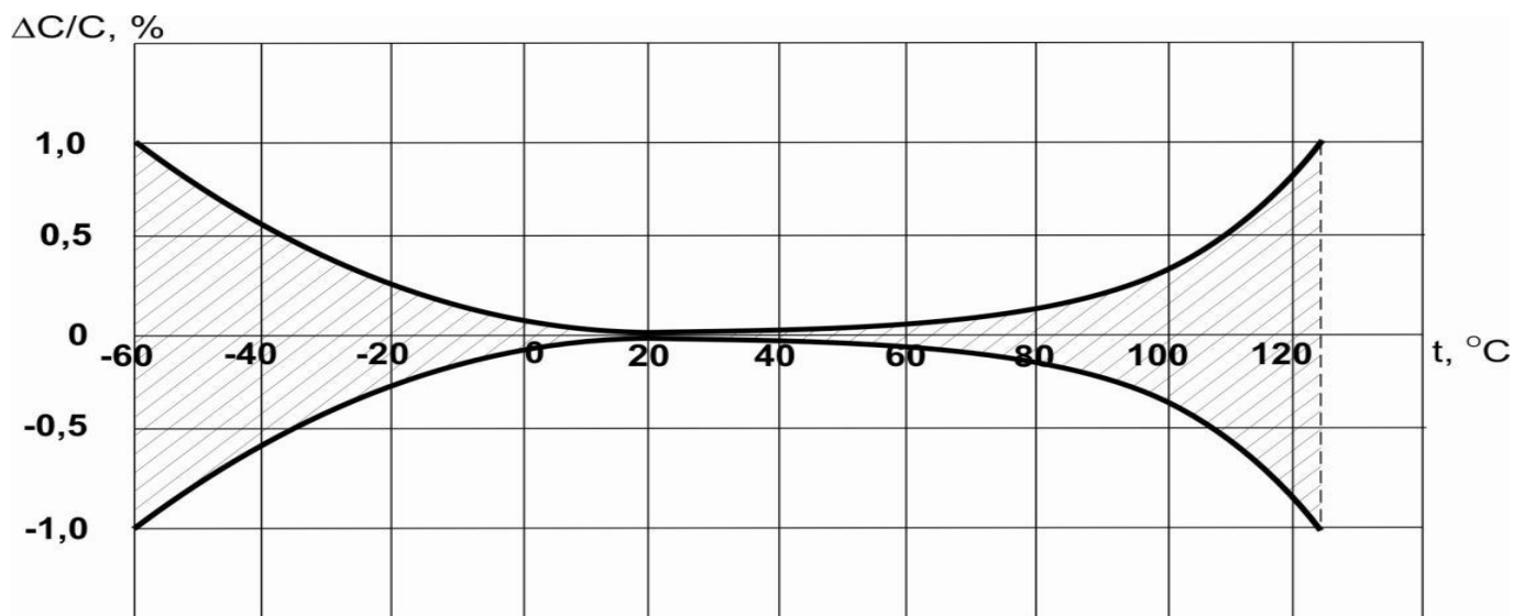
Рис.2 – Допустимая область относительного изменения емкости конденсаторов от температуры